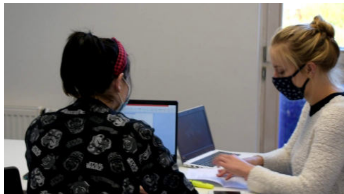
KLUB BEZTÍŽE 2 V NUSLÍCH

a trávit svůj volný čas. Nabízeli jsme proto co nejširší paletu volnočasových aktivit , které napomáhaly smysluplnému trávení volného času a podporovaly mladé lidi v rozvoji talentů. Populární bylo zejména hudební vybavení, věnovali jsme se ale například také výtvarné činnosti, v novém roce pak přibudou v klubu na návrh jeho vstěvníků nové nástěnné malby.