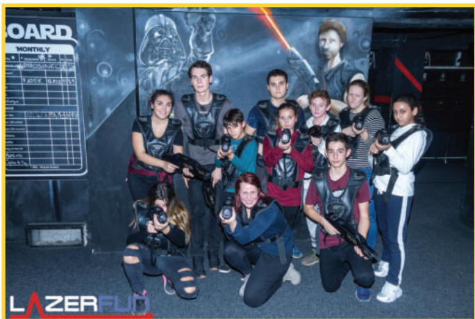
Odpoledne na Lasergame.