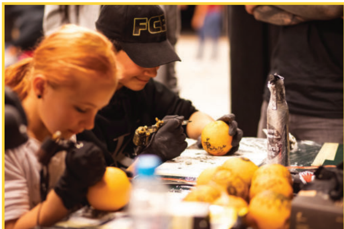
Tetovací workshop na akci Beztíze Zatápí.