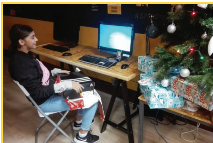
Vánoce v žižkovském Klubu Beztíze.