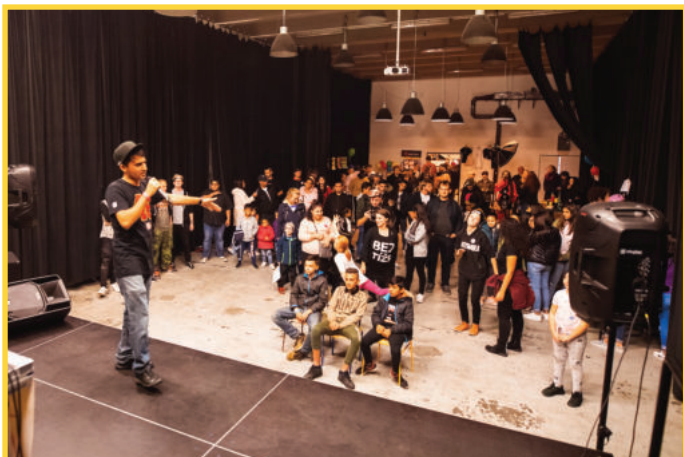
Vystoupení Gypsy CZ na akci Beztíze Zatápí.