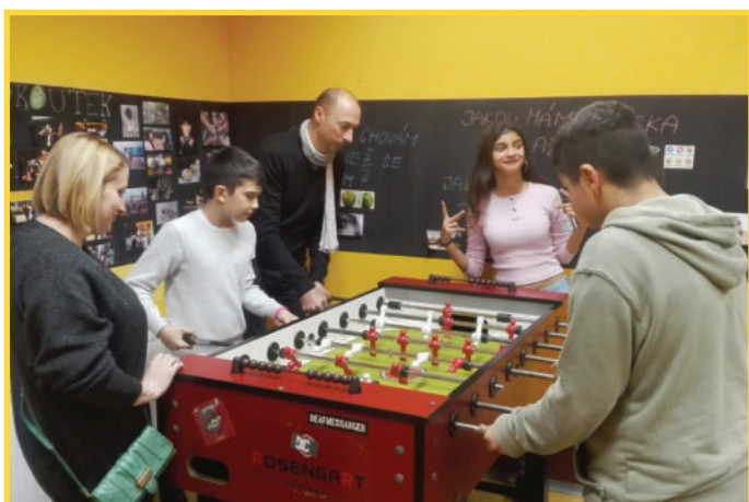
Mezinárodní návštěva v Klubu Beztíze.

Všechny naše fotky a videa naleznete na: