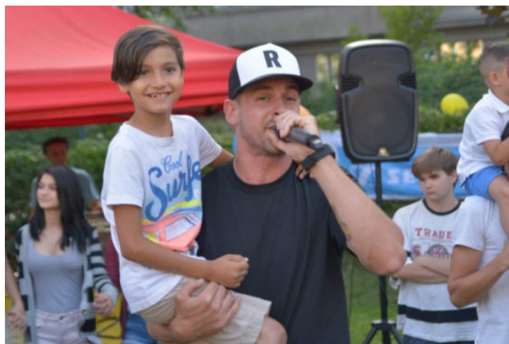
Rapper Rest na letní párty Stav Beztíže.