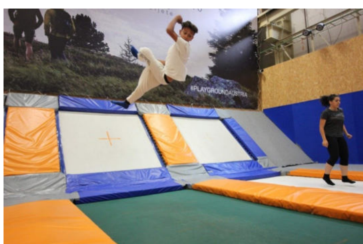
Skákej Beztíže v hale Freestyle Kolbenka.

Všechny naše fotky a videa naleznete na: