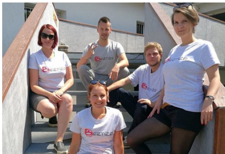
Tým Beztíže před soutěží TV Nova Co na to Češi.