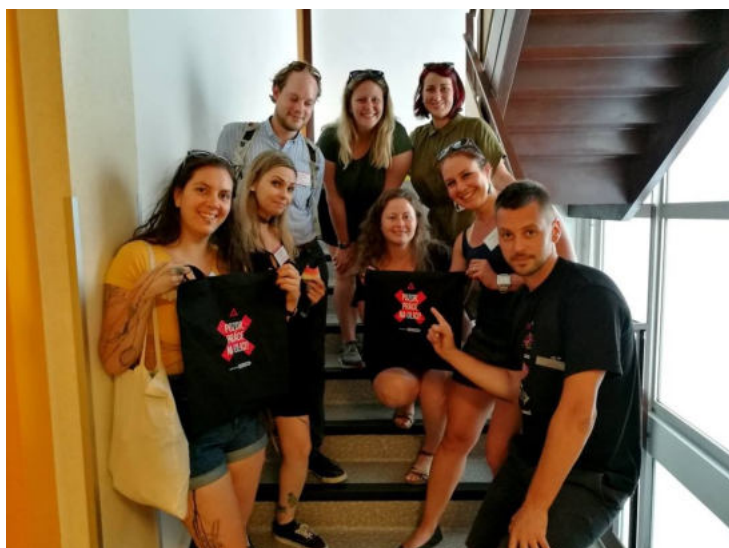
Beztíže na konferenci České asociace streetwork.