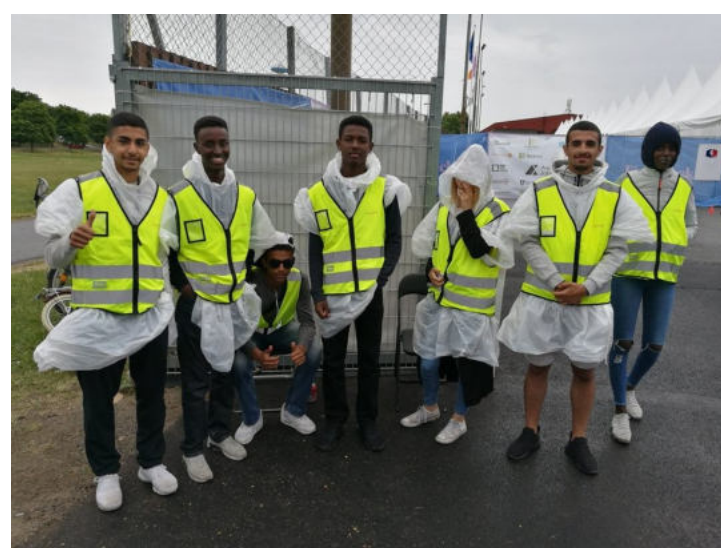
Návštěva ve Švédské organizace Fryshuset.